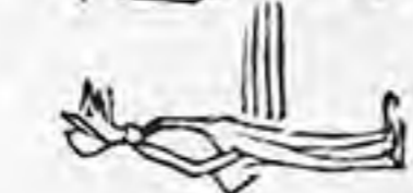
Πῆγε ἕνα παιδιὰ μου!

περιέχουσαν· θωπεύων τὴν γενεάδα του πρὸ τῆς ὁποίας ἠγορευοῦντο ὄργιλα αἱ τοῖχες τοῦ μύστακος τοῦ σφραδελίου Σπανοῦ.