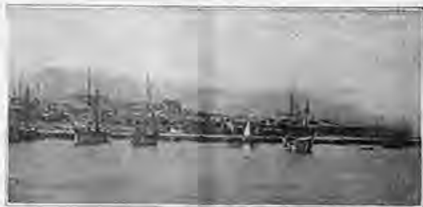
Ο ΛΙΜΝΗ ΤΗΣ ΧΙΟΥ