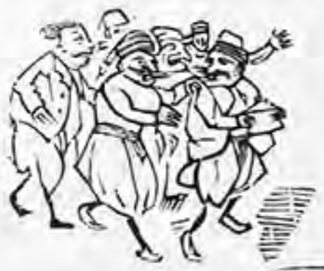
Την έβριλαν στο χέρι