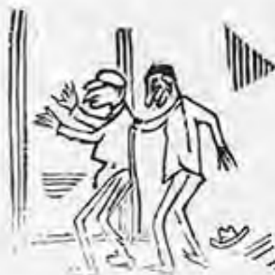
Ὀἶμοι σκότος; ψηλαφητὸν

μας τὸν μεθ’ ὄιον τὸν φουτεῖνον τίτλον του πεσοκωισθέντα ἀνδρα, ἀνιβημεν τὴν βροχθῶς καὶ τρηγοῖς διαμικτωρομένην κλίμακα τοῦ ἄνευ κτηρικῆς ἀντιωνυμίας οἰκήματος.