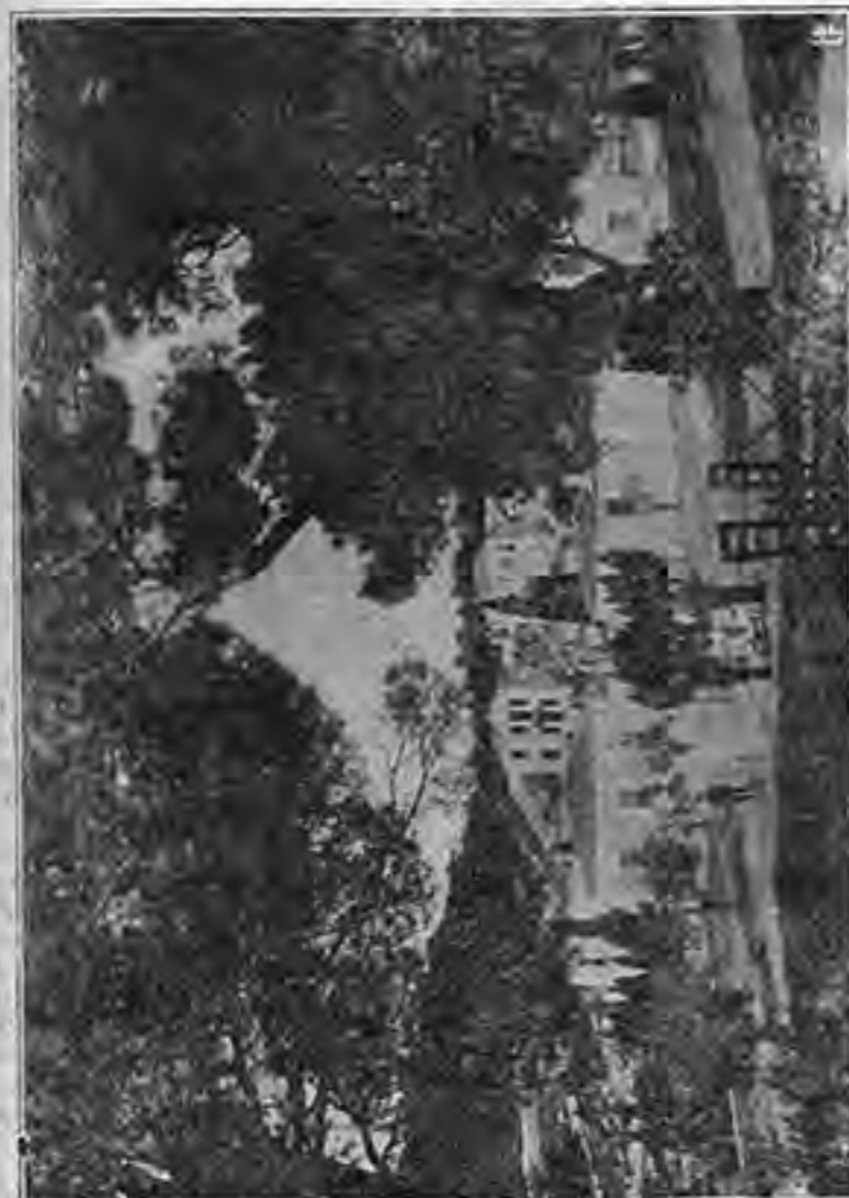
ΙΕΡΑ ΜΟΝΗ ΑΓΙΟΥ ΝΙΚΟΛΑΟΥ - ( Λύκεια )

Παρήλθεν ἰσάνος χρόνος· οἱ ἀτυχεῖς στρατιῶται ληρομνησθέντες ἐν τῇ φιλίᾳ ἡφίσταντο ἀγογγύοντας τὴν ὄψιν μὲν τῷ βασιλεῖ, ἠκούοντες πῶντο εἰς τὴν καταστολὴν τῆς ἀλη-